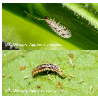
Micromus variegatus Températures optimales : 10-15°C Température min. tolérée : 4°C

mentionne que cette dernière est nettement plus performante que la « Tango » dont les plants ont été davantage affectés par un défaut d'irrigation ainsi que par le froid.