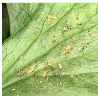
Aphidoletes aphidimyza Températures optimales : 16-25°C Température min. tolérée : 12°C